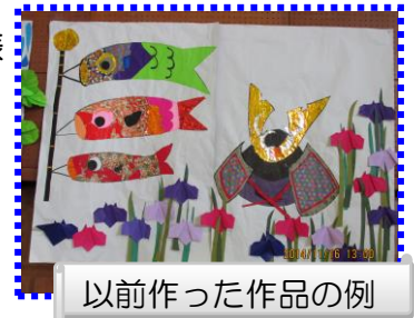
以前作った作品の例